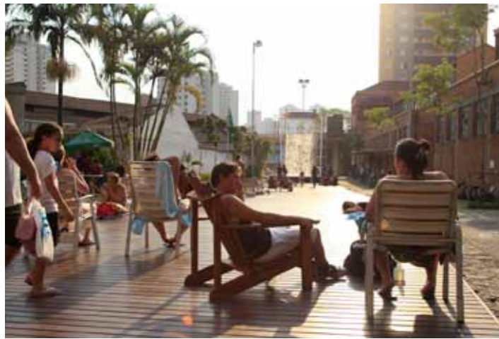
SESC Pompeia, São Paulo.