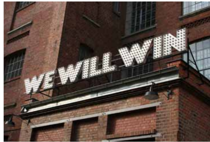
Baumwollspinnerei Leipzig.