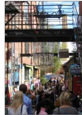
Martina Baum, Kees Christiaanse (eds.)