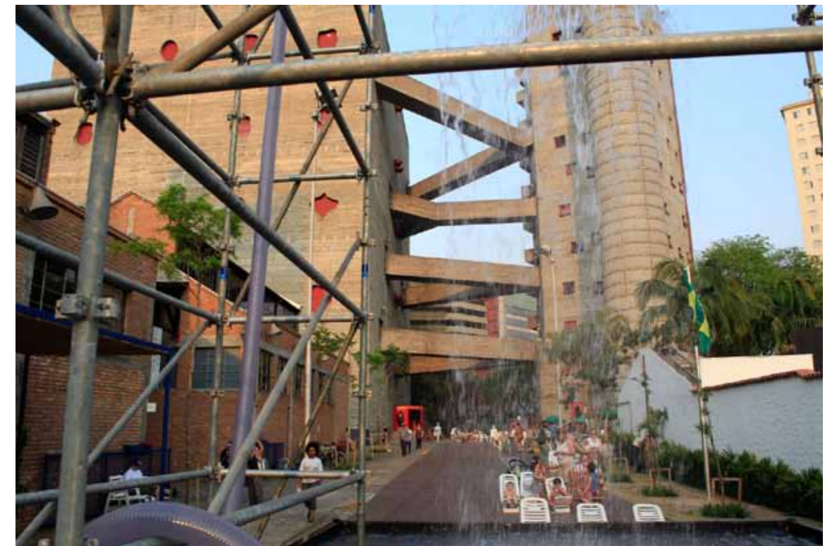
SESC Pompeia, São Paulo.

Immer geht es um den jeweiligen Ort, die Menschen und um eine Vision – dies wird in den Porträts von 30 umgenutzten Industriearealen aus aller Welt deutlich. Ihre Neuinterpretation setzt ein enormes Potenzial an Energie und Kreativität frei: in den USA, Russland, Brasilien oder China ebenso wie in Europa. Das Buch beleuchtet die Hintergründe, Akteure und Konzepte und zeigt verschiedene Strategien der Umnutzung auf. Fachleute aus Theorie und Praxis erläutern in Aufsätzen und Interviews ihre Erkenntnisse und Erfahrungen. Der niederländische Buchgestalter Joost Grootens, bekannt für seine selbsterklärenden «infographics», visualisiert die 30 Projekte und ermöglicht damit eindruckliche Vergleiche.