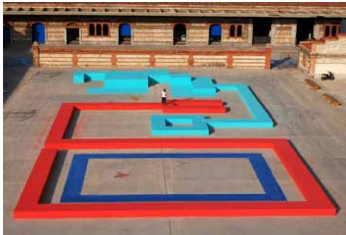
Matadero Madrid.