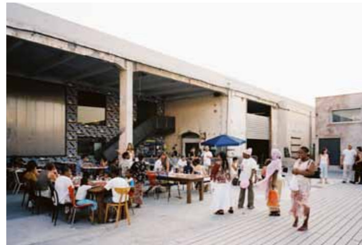
La Friche la Belle de Mai, Marseille.